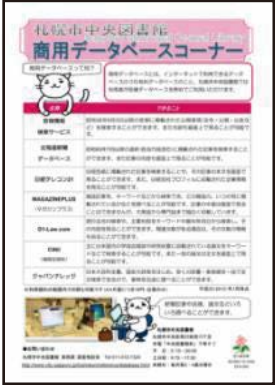
館内配布の総合案内チラシ