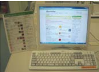
データベース用パソコン

同館では、館内配布物などでジャパンナレッジや他の商用データベースの内容を告知。また、パソコン横にもジャパンナレッジのパンフレットをディスプレイするなど常にその存在をアピールし、利用率向上へ注力していました。